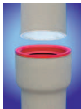
Edelkeramik-Muffenrohr mit Elastomerdichtung