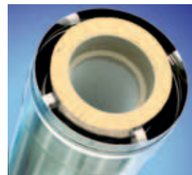
Außenschornstein mit ERLUS Edelkeramik®-Innenrohr