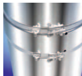
Edelstahlmantel mit Schnellspannverschlüssen