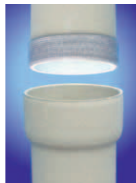
Edelkeramik-Muffenrohr mit Gewebedichtung